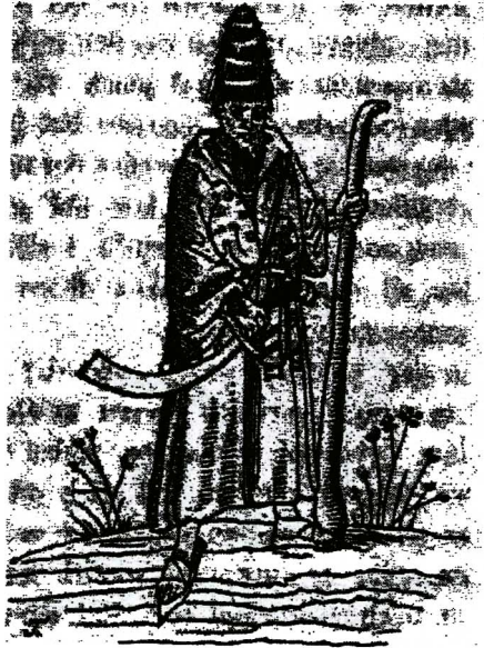
رسم رقم (١) محارب من المماليك متمنطق بسيفه

كذلك أخبرهم هذا المملوك أن السلطان يحتفظ على الدوام في هذه المدينة - أى في القاهرة- بأكثر من عشرين ألف مملوك يتكفل بنفقاتهم إذ يتكفل برواتبهم (أى الجوامك)؛ إضافة إلى هؤلاء، يوجد أيضاً أعداد هائلة من المماليك ينتشرون في مواضع عديدة من أراض سلطنته، وهؤلاء أيضاً يدفع لهم الجوامك (١) . ومن بين العشرين ألف مملوك، هناك عشرة آلاف يتغنون في القلعة ويقيمون فيها ليلاً. ومن العشرة آلاف، هناك ما بين سبعة إلى ثمانية آلاف مملوك من البالغين أو الشباب وتبلغ أعمارهم ما بين ثمانية عشر عاماً، أو عشرة، أو تسعة، أو ثمانية أو سبعة أعوام كانوا قد تخلوا عن المسيحية واعتنقوا الإسلام ويطلق عليهم اسم الأجلاب (٢) Gelepiz.